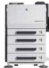
magicolor 7450II GA med duplexenhed, 3 papirkassetter og systembord