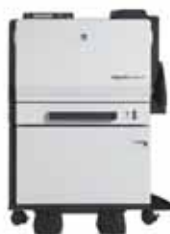
magicolor 7450II GA med duplexenhed og enkelt underskab