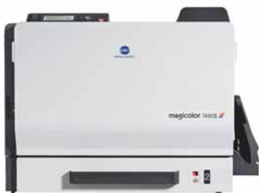
magicolor 7450II GA

Den nye magicolor 7450II GA er specielt designet til den grafiske branche. Hvad enten du er professionel grafiker, designer eller ansvarlig for det grafiske arbejde på et reklamebureau eller en tegnestue - ved du, hvor vigtig farve kvaliteten er for stort set alle de materialer, som du eller din virksomhed skaber. Med magicolor 7450II GA lancerer Konica Minolta en A3+ farveprinter i topkvalitet, der leverer livlig og fotorealistisk farve kvalitet, designet specielt til den kreative branche.